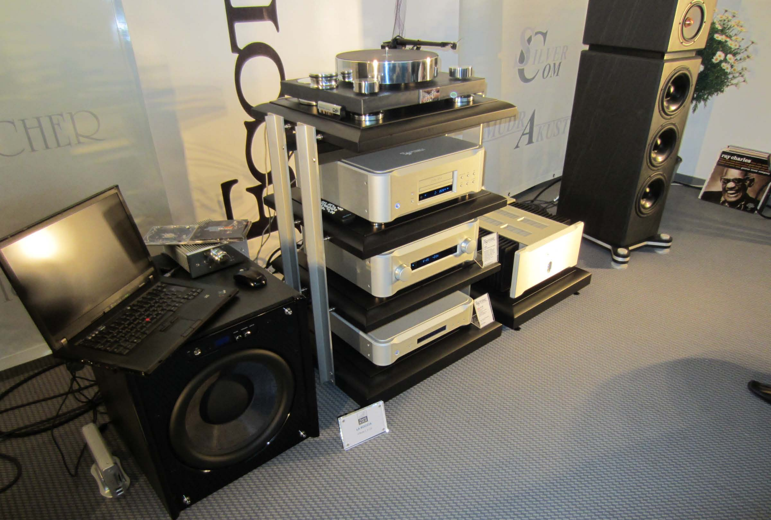
Teac Esoteric K-01 CD, A-03 Class A Stereo Power Amp. I-03 Int.Amp,, G-02 Clock on Finite Elemente rack and stand in Mudra Akustik room