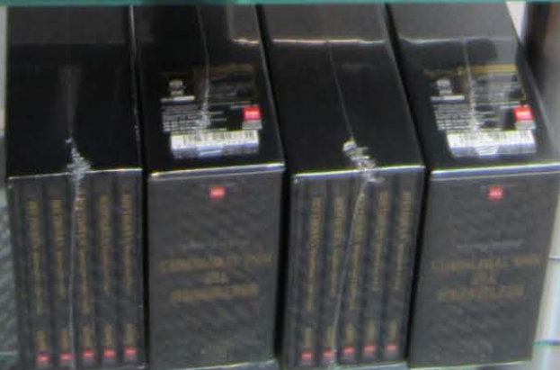
SACD / CD Hybrid titles