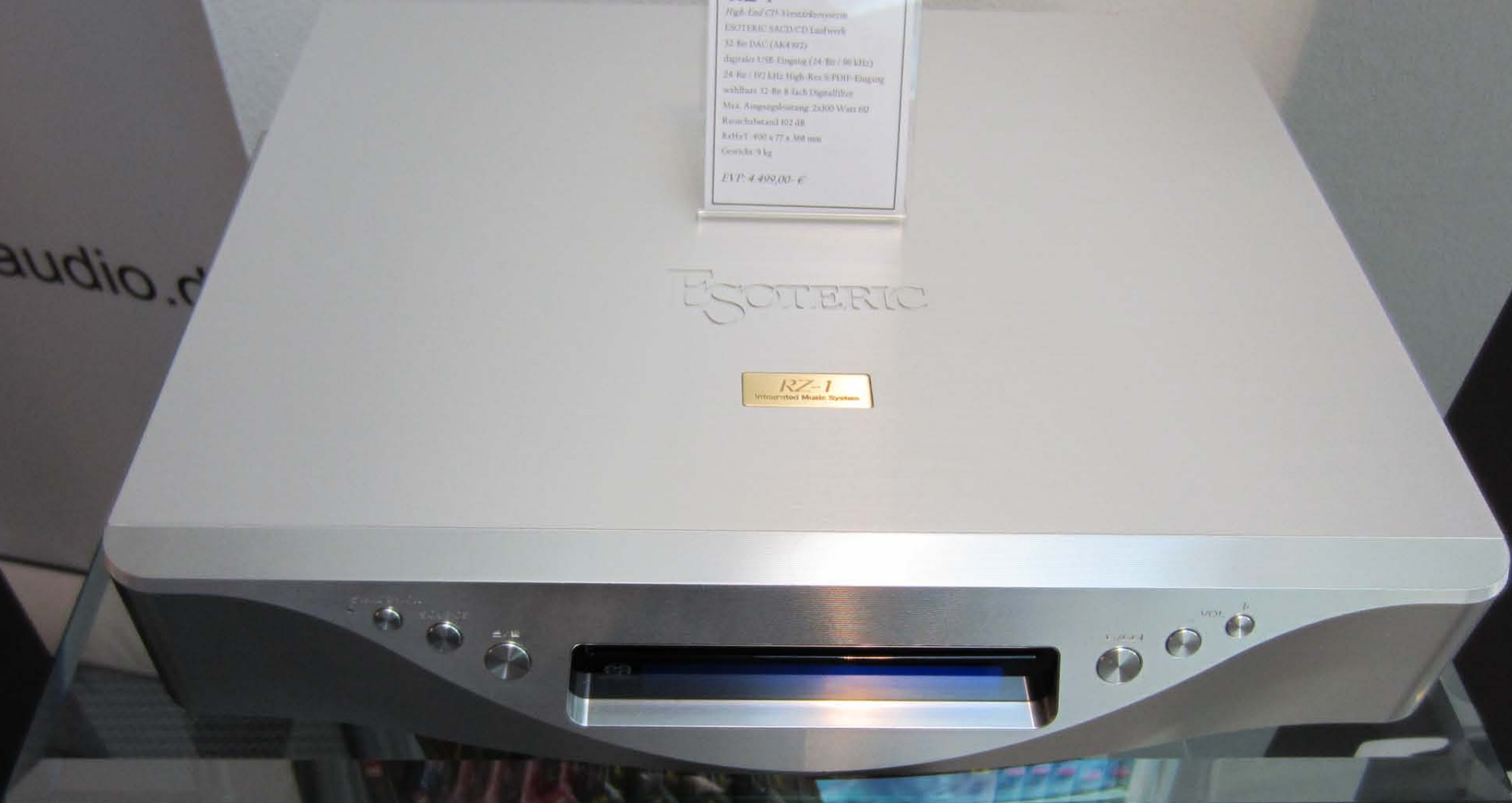
RZ-1 SACD Player with DAC and amplifier